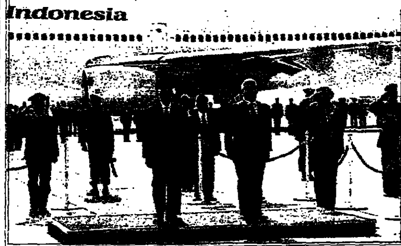
لقطان من وداع الحسين للرئيس الاندونييسي لدى مغادرته الأردن

كان (جون ملتون) طالبا في جامعة كمبرج، عندما كتب في رده على رسالة تكلمها من أحد أصدقائه: (سأنتي عن حال وعما أظن فيه ما قد لا الخلود.. فإني أرى لزما عن أن أكتب عملا أدبيا باقيا لبيدي).